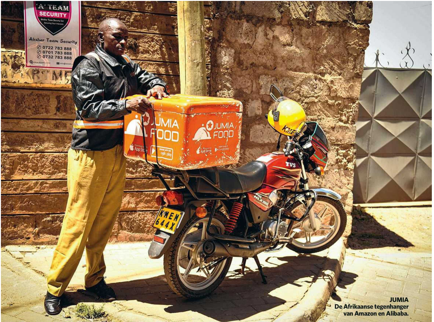
JUMIA De Afrikaanse tegenhanger van Amazon en Alibaba.