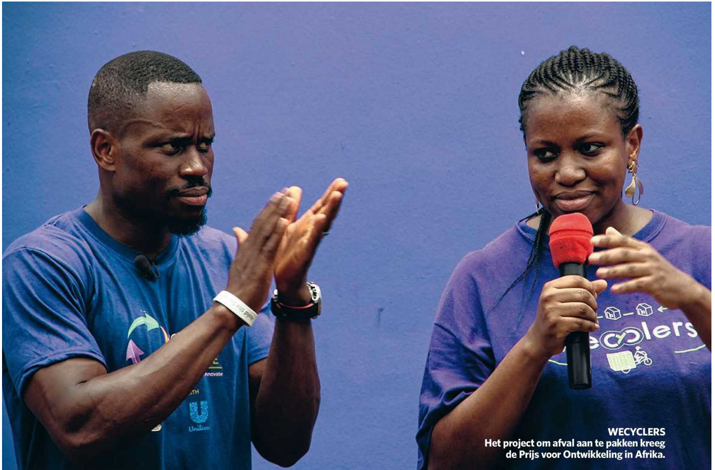
WECYCLERS Het project om afval aan te pakken kreeg de Prijs voor Ontwikkeling in Afrika.