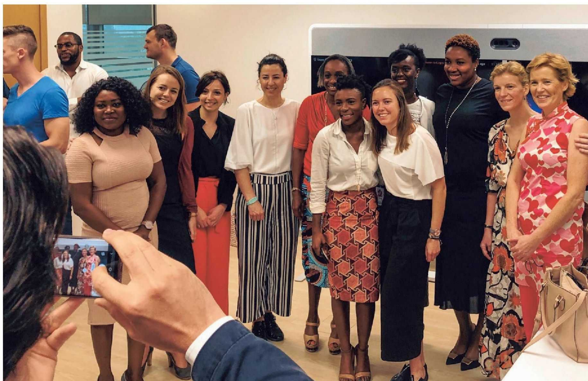
Belgische start-ups kregen de kans hun bedrijf voor te stellen aan gerenommeerde investeringsbedrijven in Nigeria. Het panel bestond uit vijf vrouwen en twee mannen.

In Yaba, een residentiële wijk in Lagos, hebben ze die boodschap het best van al begrepen. Het is de geboorteplek van meer dan 1.000 start-ups, een aantal dat met de dag blijft toenemen. Het ecosysteem is naar schatting meer dan twee miljard dollar waard in een stad die meer dan 50 procent van het bruto binnenlands product van Nigeria vertegenwoordigt. Cijfers die in eerste instantie niet al te veel zeggen. Reken daar bij dat bedrijven zoals Facebook, Google, Microsoft, IBM en General Electrics elkaar voor de